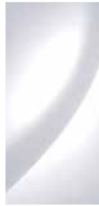
Creamy White (Uni) 1