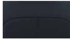
Sitzpolsterung in Leder 3 dunkelblau, Innenraum schwarz.