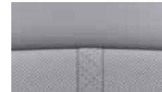
Innenausstattung in Nappa- leder 3 , zweifarbig grau, Innenraum 2-Tone (2 ver- schiedenen Grautöne).