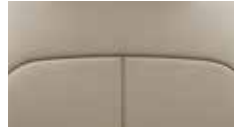
Sitzpolsterung in Leder 3 beige, Innenraum schwarz.

Die Innenausstattung des neuen Hyundai STARIA ist in verschiedenen Farbkombinationen erhältlich.