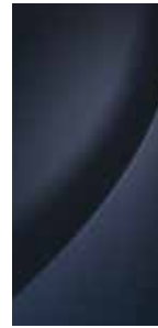
Moonlight Blue (Mineraleffekt) 1