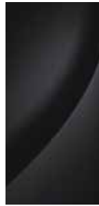
Abyss Black (Mineraleffekt) 1

Wählen Sie Ihre favorisierte Außenfarbe für den neuen Hyundai STARIA und setzen Sie die auffällige Silhouette stilvoll in Szene.