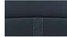
Innenausstattung in Nappa- leder 3 , einfarbig schwarz, Innenraum schwarz.