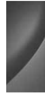
Olivine Grey (Metallic) 1