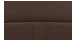
Innenausstattung in Nappa- leder 3 , zweifarbig braun, Innenraum dunkelgrau.