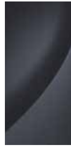
Graphite Gray (Metallic) 1