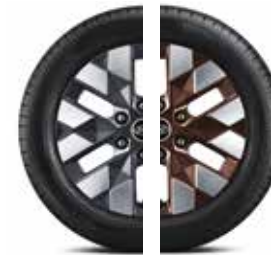
18-Zoll-Leichtmetallfelgen (Felgenfarbe abhängig von der Außenfarbe)