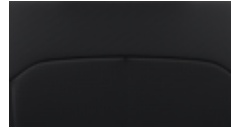
Sitzpolsterung in Leder 3 schwarz, Innenraum schwarz.