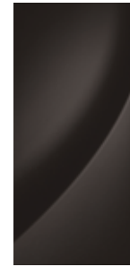
Gaia Brown (Mineraleffekt) 1