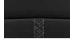
Innenausstattung in Nappa- leder 3 , zweifarbig blau, Innenraum schwarz.