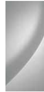
Shimmering Silver (Metallic) 2