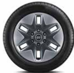
18-Zoll-Leichtmetallfelgen 235/55 R 18 Bereifung

Die 18-Zoll-Leichtmetallfelgen unterstreichen das hochwertige Äußere des modernen Multivan. 5